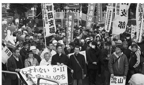
柏集会上に集まった740人の参加者