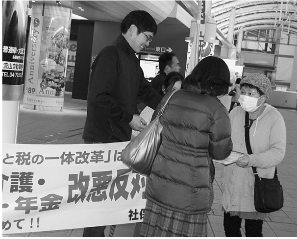
「一体改悪」の署名に応じる女性 =おおたかの森駅(23日)