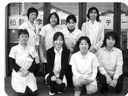
スタッフ一同(前列左から2番目が筆者)

病院勤務から訪問看護ステーションに異動になり1年経ちました。1年前：自分で訪問前にガラガラと洗濯機をまわして訪問着を洗い、カーナビではなくアナログ式に地図を見て利用者さんのお宅へ。夏は猛暑、冬は寒い：病院と